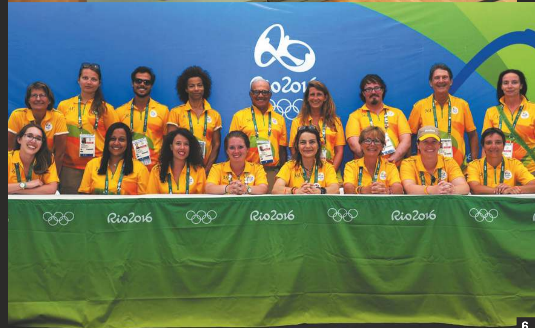
1. Autonomy transporta tehnoloģiju konferencē Parīzē, 2018. 2. Brīvdienas Skotijā – viena no (manuprāt) skaistākajām valstīm, kur braucu brīvdienās gandrīz katru gadu. 3. Zemūdens piedzīvojumi Bali salā kopā ar mammu. 4. Ieskatš manos arhitektūras studiju darbos. Studiju laikā turpināju trenēt džu, un bieži pārstāvēju universitātes klubu sacensībās, kā arī ieguvi melno jostu. 5. Piedalījos Rio 2016 Olimpiskajās spēlēs kā brīvprātīga.