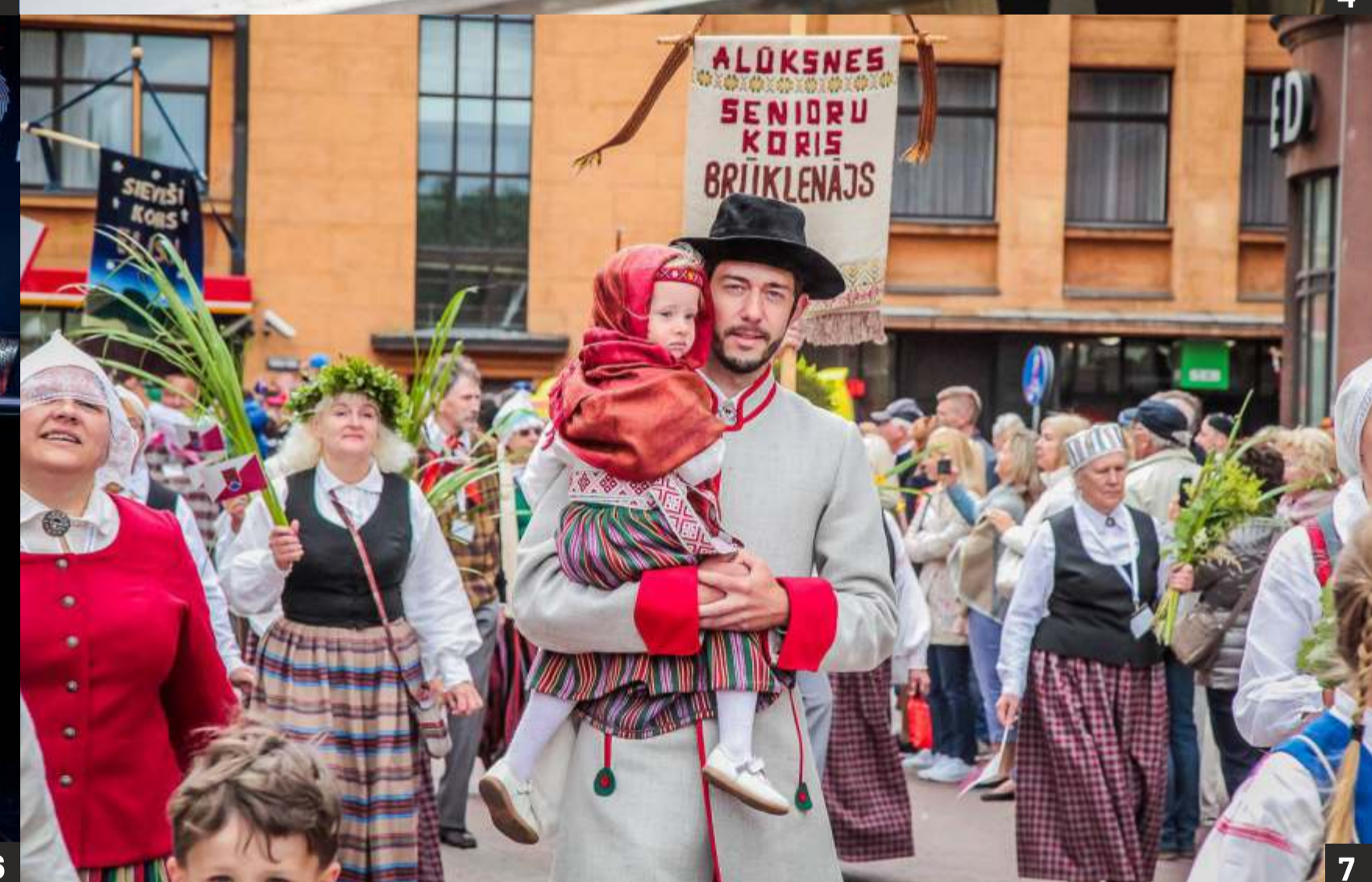
1. Dizaina studijas TEIKA projektu vadītājs. 2. un 4. PIKC Liepājas Mūzikas, mākslas un dizaina vidusskolā 3. Koncertuzveduma "Māja, skurstenis un mēs" Idejas, koncepcijas līdzautors, grafiskā dizaina un scenogrāfijas autors. 2018. gads. 5. un 6. Liepājas Kultūras balvas 2019. Liepājas Mūzikas, Mākslas un dizaina vidusskola saņem balvu par jomas visaptverošu daudzveidību pieredzes apmaiņas platformas Dizaina dienas 2019 īstenošanu. 7. Dziesmu svētku gājienā.