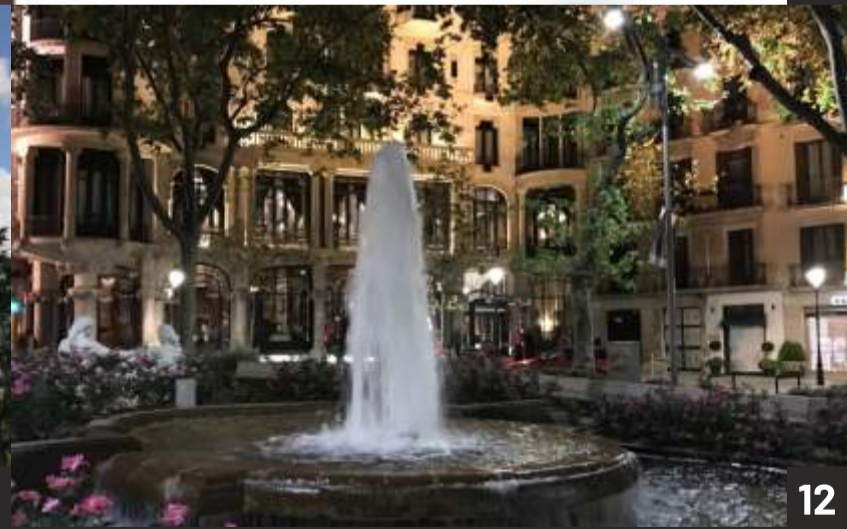
1. Bondi pludmale, Sidneja, Austrālija 2. Viena no mājās skicēm 3. Foto sesija Honkongā 4. Brenda MODEMENT reklāmas fotogrāfija, Honkonga 5. Kaikoura, Jaunzēlande 6. Publikācija žurnālā Jessica, HK 7. Kvīnstauna, Jaunzēlande 8. Honkonga 9. Ko Samui, Taizeme 10. Jaunzēlande 11. Honkonga 12. Barselona, Spānija