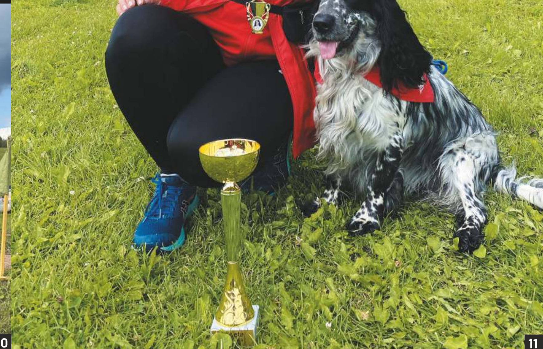
1. Mākslas skolas plenērā ar bērniem gleznojot Benevillas ēku, un pēc tam izstādot darbus Benevillas telpās publiskai apskatei. 2. "Ziemassvētku dekorī – viena no mīļākajām tēmām floristikā." 3. Broša ankar tehnikā. 4. Tamborēta sega mazulim.. 5. Kāzu floristika – Taivo Pillera floristikas skola, Izbraukuma sesijā Muhu salā.. 6. Galdauts Frivolitē tehnikā. 7. Kaklarota ankar tehnikā.. 8. un 9. Košākās no kūkām. 10. un 11. Iizes hobijs – sunis!